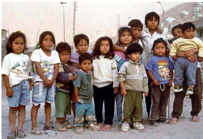
Tutti in fila per una foto ricordo da Huaycan